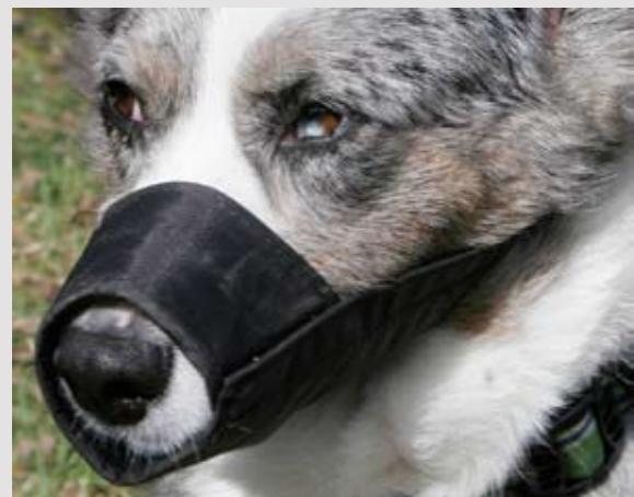
Med en dyrlægemundkurv kan hunden ikke åbne munden eller halse, og de er kun beregnet til brug i få minutter ad gangen.