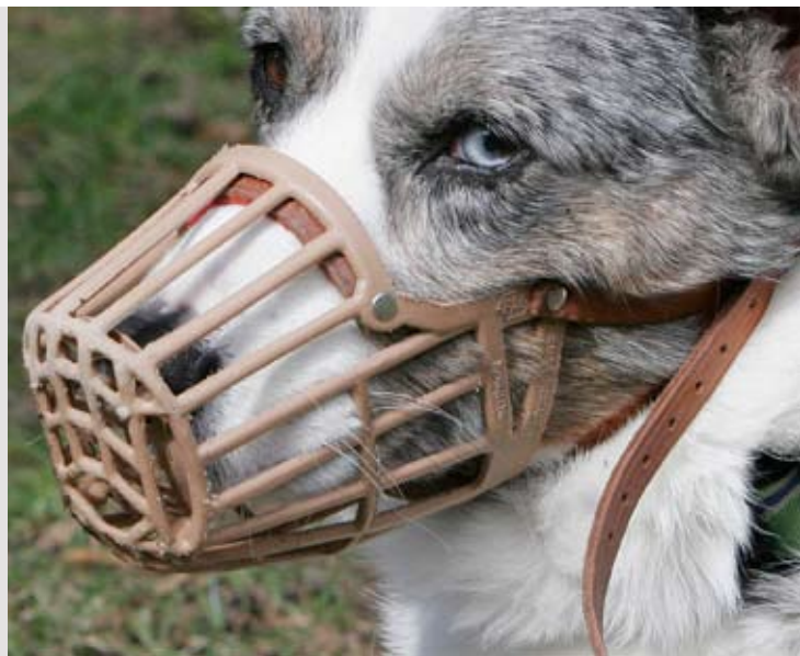
Mundkurv, hvor hunden kan åbne munden og trække vejret frit.

D et er ikke synd for en hund at bære mundkurv, men det skal naturligvis være en, hvor hunden kan åbne munden og trække vejret frit, samtidig med, at den sidder godt fast om hals/nakke. Man må ikke bruge stofmundkurvene, som kendes fra dyrlægebesøg, fordi man synes, at de ser mindre drabelige ud. Med sådan en på kan hunden ikke åbne munden eller halse, og de er kun beregnet til brug i få minutter ad gangen. En mundkurv må ikke forveksles med en grime, som ikke har noget som helst med en mundkurv at gøre, men alene er beregnet på at styre store hunde, når man går med dem – ligesom når man trækker med en hest.