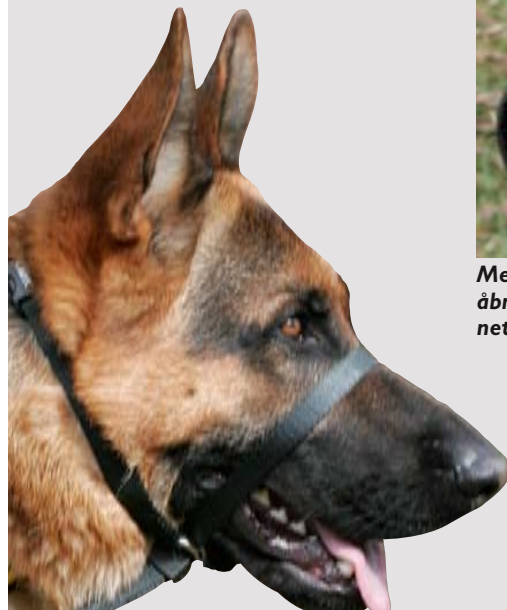
Grimen har ikke noget som helst med en mundkurv at gøre, men er beregnet på at styre store hunde, når man går med dem.